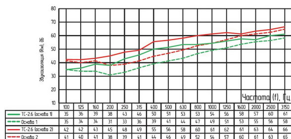
Частотные характеристики изоляции воздушного шума, R_w(f)

Тонкая система для звукоизоляции межкомнатных стен и перегородок в квартирах, загородных домах и нежилых помещениях. Отличается быстрым и простым монтажом. Обеспечивает помещение акустическим комфортом благодаря ослаблению передачи бытового шума во всем слышимом диапазоне частот. Основным элементом системы является тяжелая комбинированная панель SonoPlat Kombi.